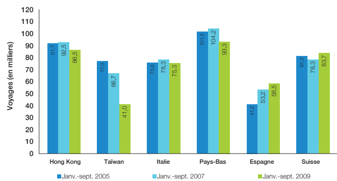
Voyages au Canada, par marchés

Remarque : Estimations préliminaires de Statistique Canada.