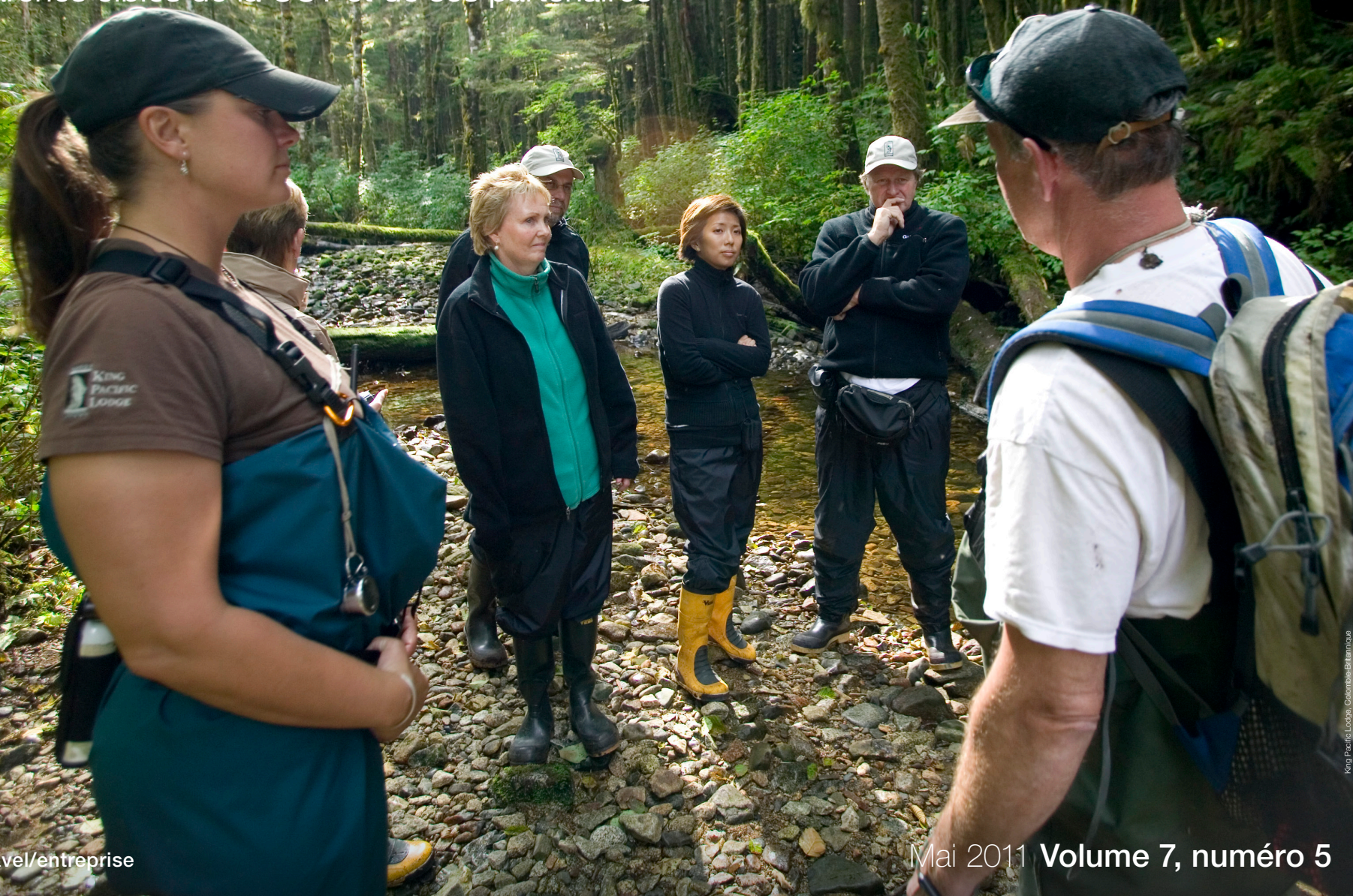
King Pacific Lodge, Colombie-Britannique

Les marchés cibles de la CCT et de ses partenaires